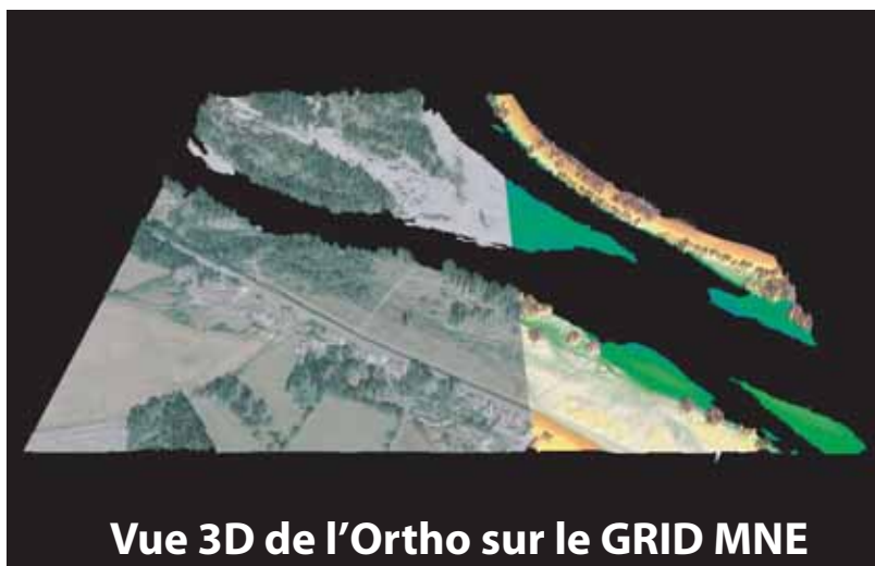
Vue 3D de l'Ortho sur le GRID MNE

en gras, ensemble des produits standards livrés sur DVD