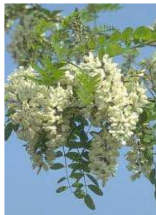
Vue générale Partie végétative