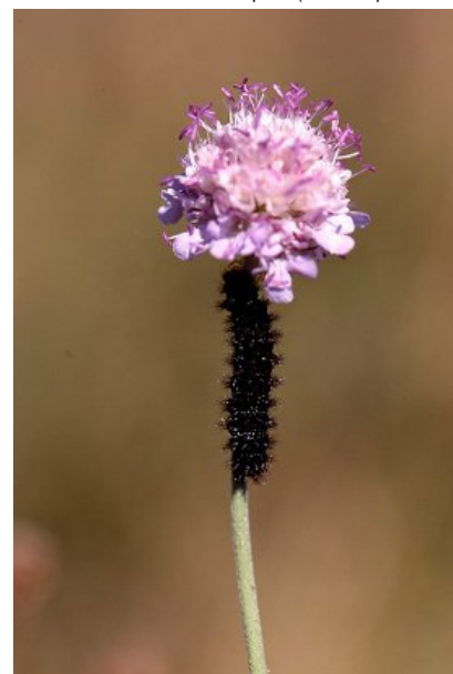
Chenille et Succise des prés ( Succisa pratensis )

En Région Centre, ses effectifs sont faibles et sa répartition est lacunaire.