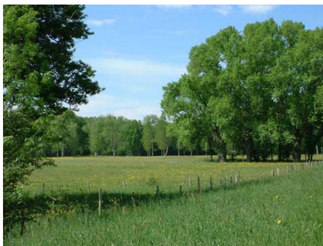
Les prairies des basses vallées : habitat des oiseaux prairiaux d'intérêt communautaire (CA37, 2004)