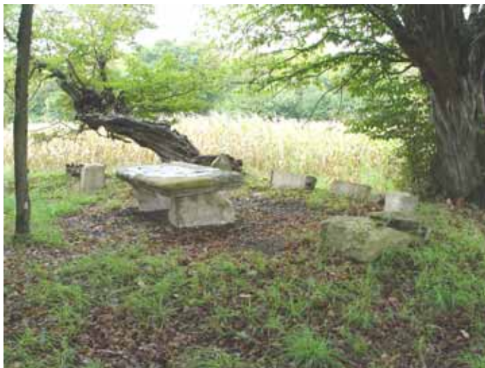
Vue de l'ensemble du tombeau, certains fragments ont été assemblés et agencés pour former une table

Propriété privée, accès public par chemin communal à proximité