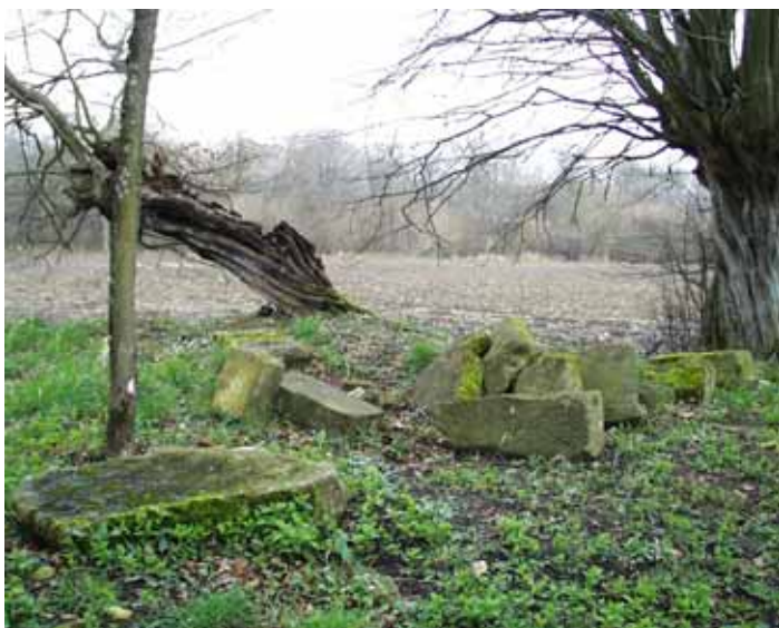
Pierres du tombeau avant transformation

Si les pierres restaient à leur emplacement actuel, une signalétique pourrait être installée au bord de la route et sur le site afin d'annoncer aux promeneurs l'existence d'un site inscrit ce qui, espérons-le, pourrait dissuader les personnes mal intentionnées d'abîmer davantage les pierres patrimoniales de Sainte-Thorette.