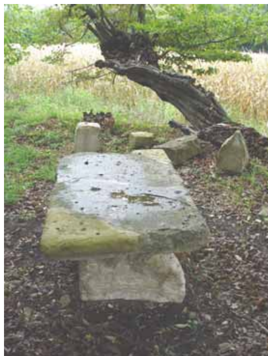
Détails de la table reconstituée