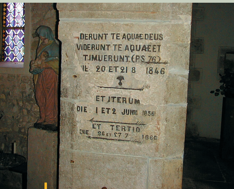
Eglise de St-Firmin

On ne peut pas supprimer totalement le risque naturel d'inondation, on peut seulement en diminuer les conséquences en améliorant la prévention, la prévision et la protection.